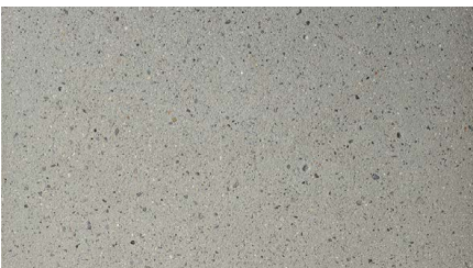
Betonplatten, 6-eckig, leicht kugelgestrahlt.